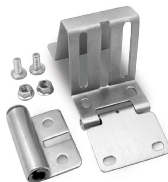
TOORS GUARDY - FSP Hoesch T09-040-40-0044

Indien u vragen heeft over dit Product Info, kunt u contact opnemen met Toors.