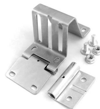
TOORS INDY - Hoesch T09-040-40-0045